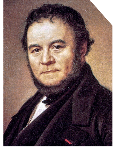
Stendhal

Entendre sa quête de connaissance du soi, sans "fioritures", et respirer, bien avant un Fanfan la tulipe, l'aventurier solaire sous le ciel de l'Italie, son paradis de femmes, d'opéras, de l'art de vivre, loin du faux tempérament de sa France, de Grenoble et de Paris.