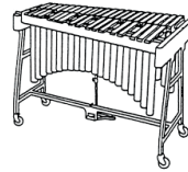
B - xylophone