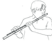
C - flute traversiere