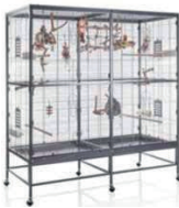
4 - volière