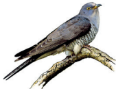
1 - coucou

Le spectacle proposé aujourd'hui ne reprend pas fidèlement la musique de Camille Saint-Saëns mais s'en inspire très souvent à travers les différentes présentations des animaux. Sauras-tu associer le bon instrument à l'animal décrit par les artistes, en considérant la hauteur et la puissance sonore de chaque instrument ?