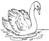
5 - cygne