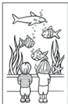
5 - aquarium