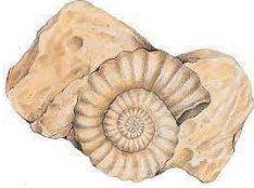
2 - fossiles