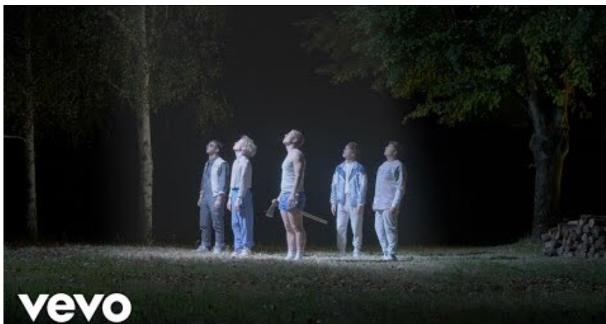
BLOOD IN LOVE