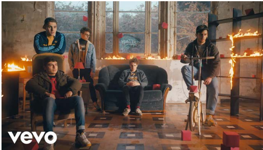
LOBSTERS & CHERRIES